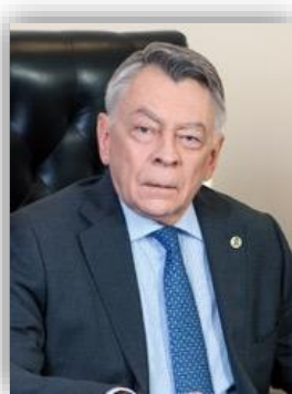
Президент РТУ МИРЭА, академик РАН А.С. Сигов