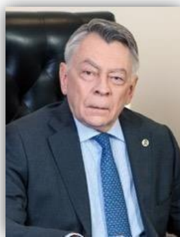
Президент РТУ МИРЭА, академик РАН А.С. Сигов